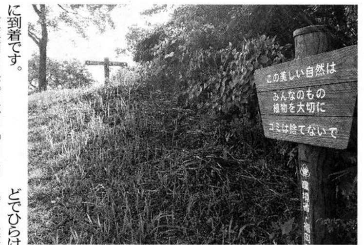
手前は福岡県、奥は佐賀県。それぞれの県境の道標

道なので登山の格好をされた方が多く見られます。竹林を通り、尾根を越えてしばらく歩くと三差路に出ます。右に行くと大佐野タム(同県太宰府市)に、左に行くと天拝湖(同県筑紫野市)につながっています。九州自然歩道は天拝湖を目指して進みます。なだらかな下り道を歩いていくと舗装路に変わり、天拝湖